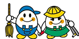
ピッカ ピッケ 京都市まちの美化推進事業団シンボルキャラクター