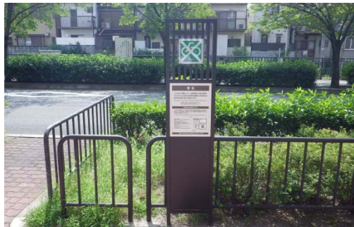
自転車撤去警告看板